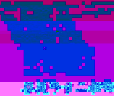
普法宣传月二举措